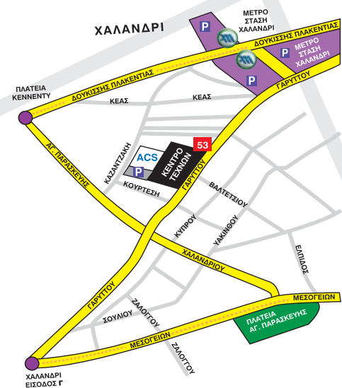
Οδηγίες πρόσβασης στο Κέντρο Τεχνών στο ACS

Η παρουσίαση θα κλείσει με λεπτομερή εξέταση της στρατηγικής της Ελλάδας ως χώρας, αλλά συνάμα και των Ελληνικών επιχειρήσεων, στα πλαίσια μιας εποχής όπου, ο προσδιορισμός τόσο των ανταγωνιστών, όσο και των επιχειρήσεων ακόμα και των πελατών, είναι δυσκολότερος παρά ποτέ. Ο Ohmae στην ημερίδα δεν θα κάνει απλά μείνι για το τι έχει ήδη συμβεί αλλά θα προσφέρει οδηγό δράσης στον καινούργιο αναδυόμενο κόσμο.