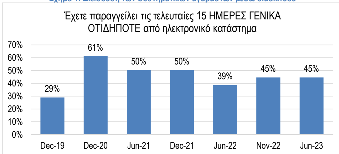
Σχήμα 1: Διείσδυση των συστηματικών αγοραστών μέσω διαδικτύου

Τα αποτελέσματα καταγράφουν ένα ώριμο καταναλωτικό κοινό στα ηλεκτρονικά κανάλια με προοπτικές ανάπτυξης, Η ωριμότητα του ηλεκτρονικού εμπορίου καταγράφεται από το γεγονός της διατήρησης της αύξησης των online αγορών κατά τις περιόδους μετά την έξαρση της πανδημίας COVID και τα τότε μέτρα περιορισμού κυκλοφορίας. Σύμφωνα με τα αποτελέσματα της έρευνας (σχήμα 1), το 45% των χρηστών διαδικτύου προέβη σε κάποια αγορά μέσω διαδικτύου το τελευταίο 15ήμερο, ποσοστό ίδιο με τον Νοέμβριο 2022 και σαφώς αυξημένο σε σχέση με το