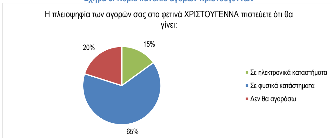
Σχήμα 3: Κύρια κανάλια αγορών Χριστουγέννων

Τα παραπάνω ευρήματα σχετίζονται και με τις εξελίξεις σε σχέση με την επίδραση που έχει η αύξηση του κόστους ενέργειας και των ανατιμήσεων στο διαθέσιμο εισόδημα των καταναλωτών. Τα αποτελέσματα της έρευνας καταγράφουν τη σημαντική αλλαγή που επήλθε στο καταναλωτικό κοινό τον τελευταίο χρόνο και την μεγάλη επίδραση των πληθωριστικών πιέσεων στο διαθέσιμο εισόδημα και κατ' επέκταση στην αγορά της λιανικής στην Ελλάδα.